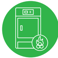
KOTEL NA BIOMASU